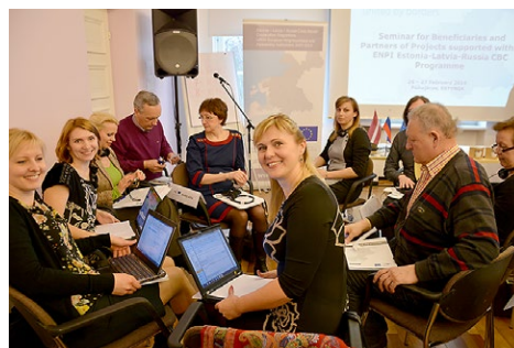
Совместное выполнение практических заданий вызвало большой интерес.

В ходе семинара была возможность получить подробные индивидуальные консультации у представителей руководства Программы. Команда проекта воспользовалась этой возможностью, что помогло более эффективно подготовить 1-й отчет работы по проекту.