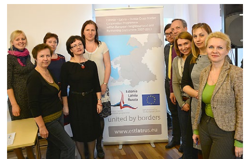
Фото на память с руководителями Программы.