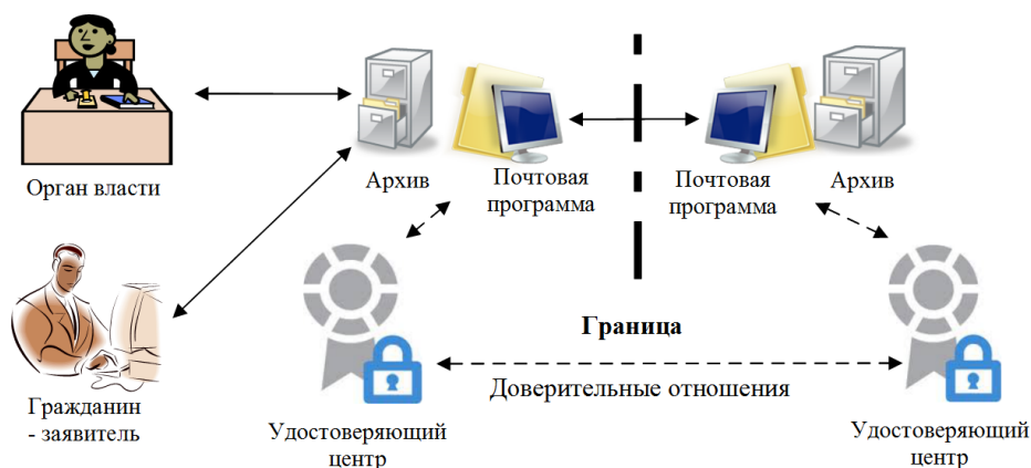
Схема рабочего варианта электронного взаимодействия участников трансграничного архивного документооборота Эстонии и России

Экспертная группа еще раз рассмотрела и проанализировала наработанные ею варианты э-решений, проиллюстрированные ниже, и договорилась об их практическом тестировании после летних отпусков.